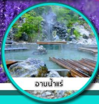
ออนน้ำแร่