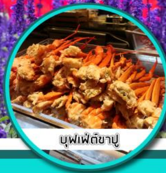
บุฟเฟ่ต์ซาปู