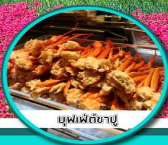
บุฟเฟ่ต์ชาปู