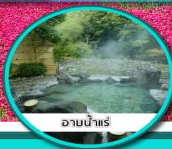
ออนน้ำแร่