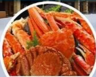
ชาปูยักษ์ 3 ชนิด