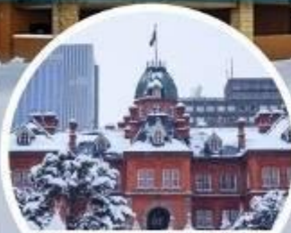
ท่าเทียบรัฐบาลท่าฮอกไกโด