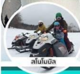
สโนว์โมบิล