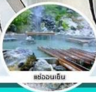
แช่ออนเซ็น