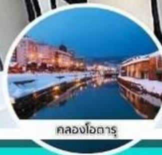
คลองโอดารุ