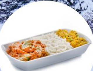
อาหารบนเครื่องบิน