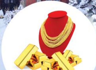
ลุ้นรับรางวัลทองคำ