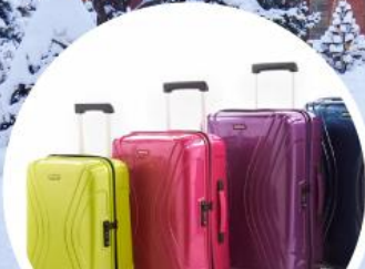
กระเป๋า 20 Kg