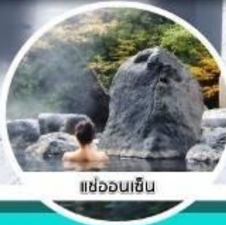
แช่ออนเซ็น