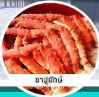
ซาปูยักษ์

25 ก.พ.- 1 มี.ค.62 / 4-8 / 11-15 มี.ค.62 18-22 / 25-29 มี.ค.62 / 1-5 พ.ย.62 8-12 / 15-19 / 22-26 พ.ย.62 29 พ.ย.-3 พ.ค.62 / 6-10 พ.ค.62