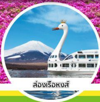
ล่องเรือหงส์