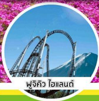
ฟูจิคว ไฮแลนด์

26 / 27 / 28 / 29 พ.ค. 62 2 / 3 / 4 / 5 / 9 / 10 / 11 / 12 / 16 พ.ย. 62 17 / 18 / 19 / 23 / 24 / 25 / 26 / 30 พ.ย. 62 1 / 2 / 3 / 7 / 8 / 9 / 10 / 11 / 14 พ.ค. 62 15 / 16 / 17 / 21 / 22 / 23 / 24 / 28 พ.ค. 62 29 / 30 / 31 พ.ค. 62