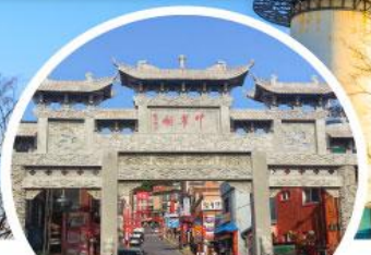
โซน่าทาวน์