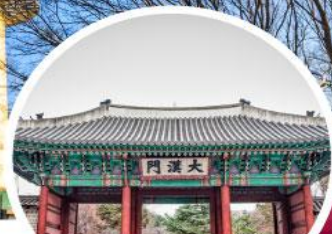
พระราชวังต็อกซูกุง