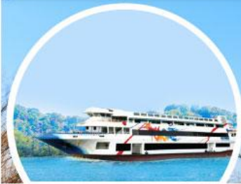
เรืออาร์ครุยส์