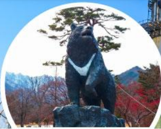
โซริคซาน